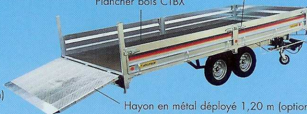
Hayon en métal déployé 1,20 m (option) avec béquilles ou 2 rampes amovibles stockées sous châssis (option)