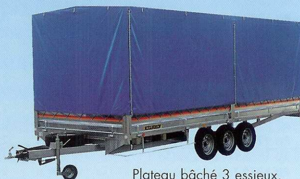
Plateau bâché 3 essieux.