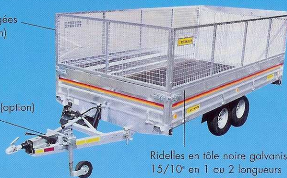
Rehausse grillagées H 0,80 m (option)