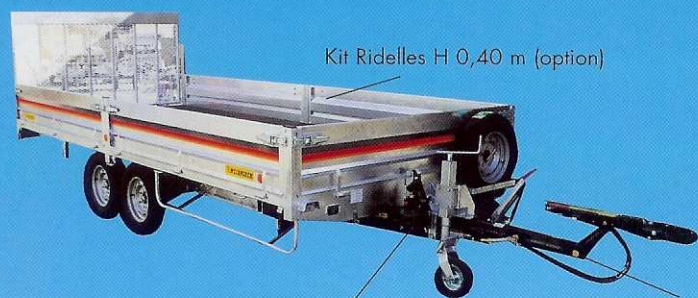
Kit Ridelles H 0,40 m (option)