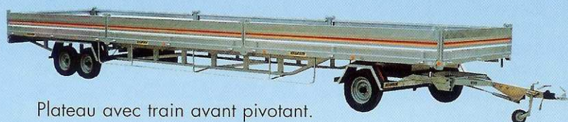
Plateau avec train avant pivotant.