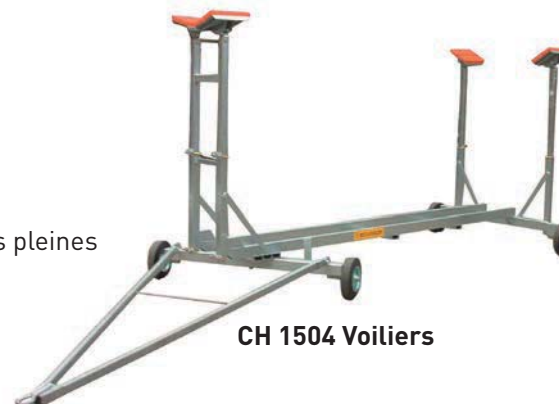
CH 1504 Voiliers