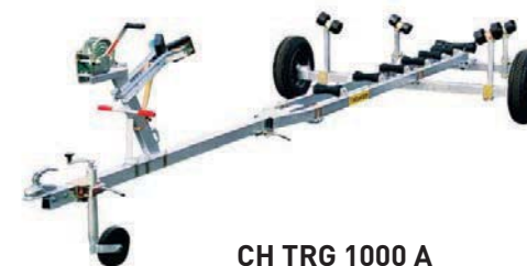
CH TRG 1000 A