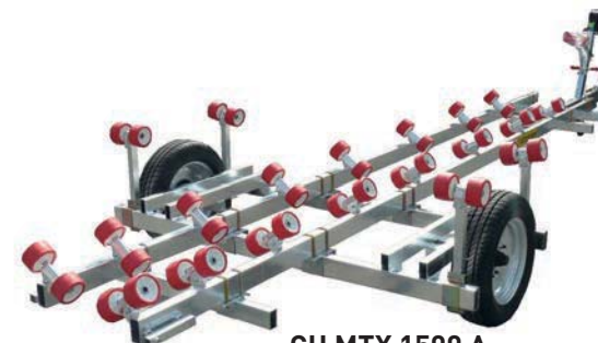
CH MTX 1500 A

Chariot de mise à l'eau pour bateau à petite quille (chemin de roulement central)