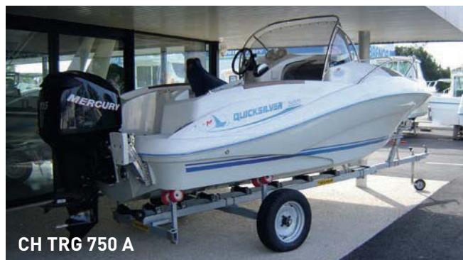
CH TRG 750 A