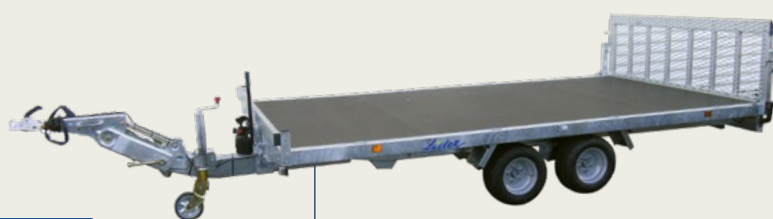
33655L avec option kit hydraulique de basculement 406x215