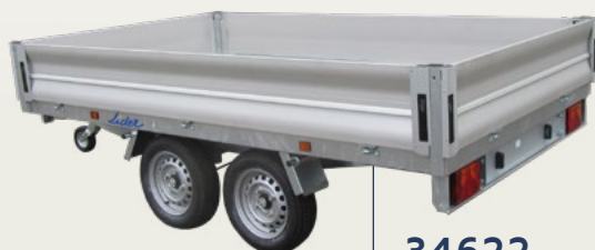
34622 avec option ridelles alu 306x170