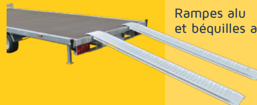
Rampes alu et béquilles arrière