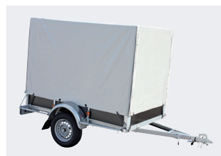
Option: bâche haute