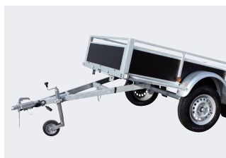
Option: timon basculante