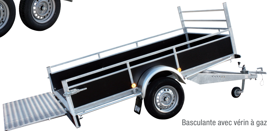
Basculante avec vérin à gaz