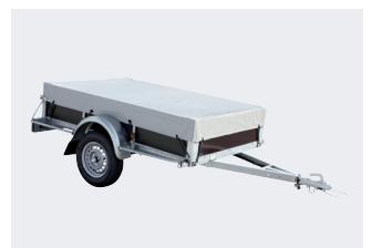
Option: bâche plate