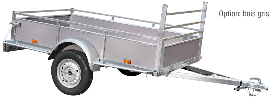
Option: bois gris