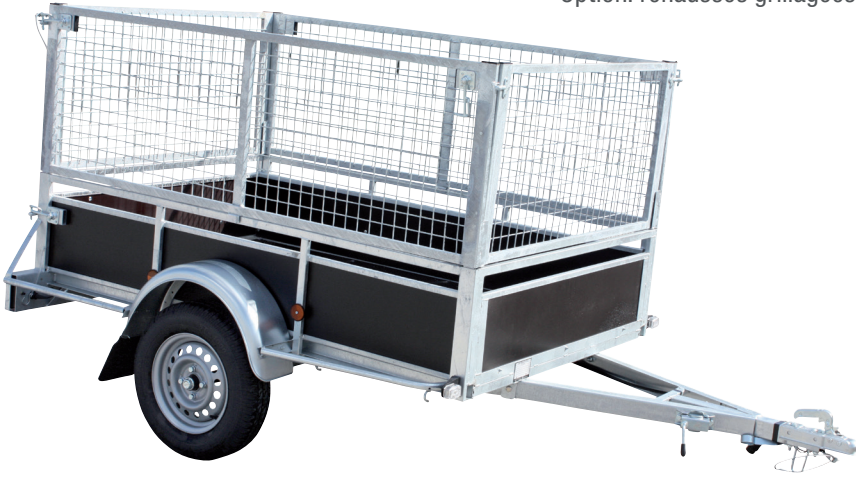
Option: rehausses grillagées