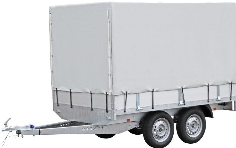
Option: bâche haute