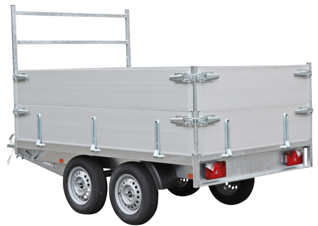
Option: rehausses ridelles aluminium