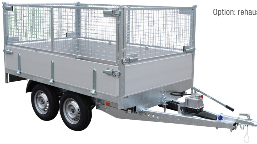
Option: rehausses grillagées