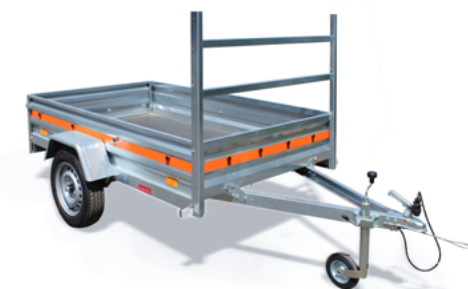
ECO 2312 • PORTE ÉCHELLE AVANT