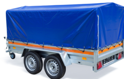
ECO 2612/2 • BÂCHE HAUTE H800 + ARCEAU