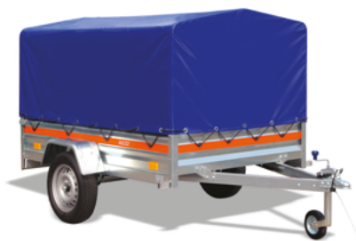
ECO 2312 • BÂCHE HAUTE H800 + ARCEAU