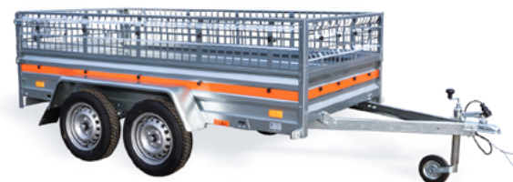
ECO 2612/2 • RIDELLES GRILLAGÉES