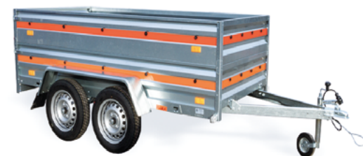
ECO 2612/2 • REHAUSSES DE RIDELLES