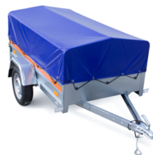
ECO 2010 • BÂCHE HAUTE H400 + ARCEAU