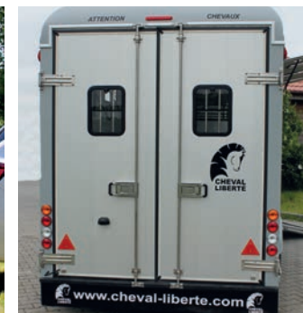
> Double porte arrière en option