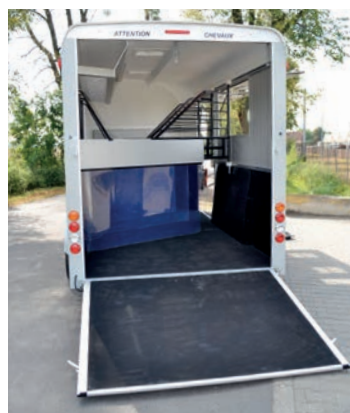
> Pont porte arrière de série