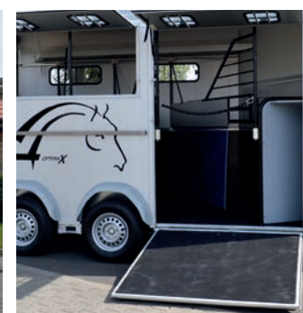
> Large pont avant