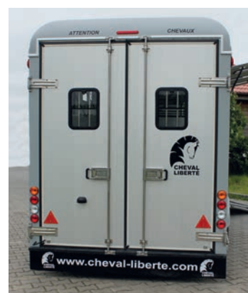
> Double porte arrière en option