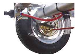
Kit de rinçage des tambours en option