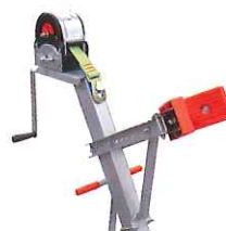
Potence de treuil