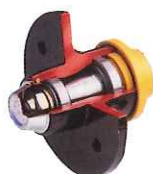
Roulement de moyeux étanche